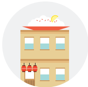
방문자 출입 관리가 필요한 중소형 식당