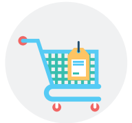
유동손님이 많은 대형쇼핑몰