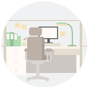
출입보안이 필요한 빌딩/사무실